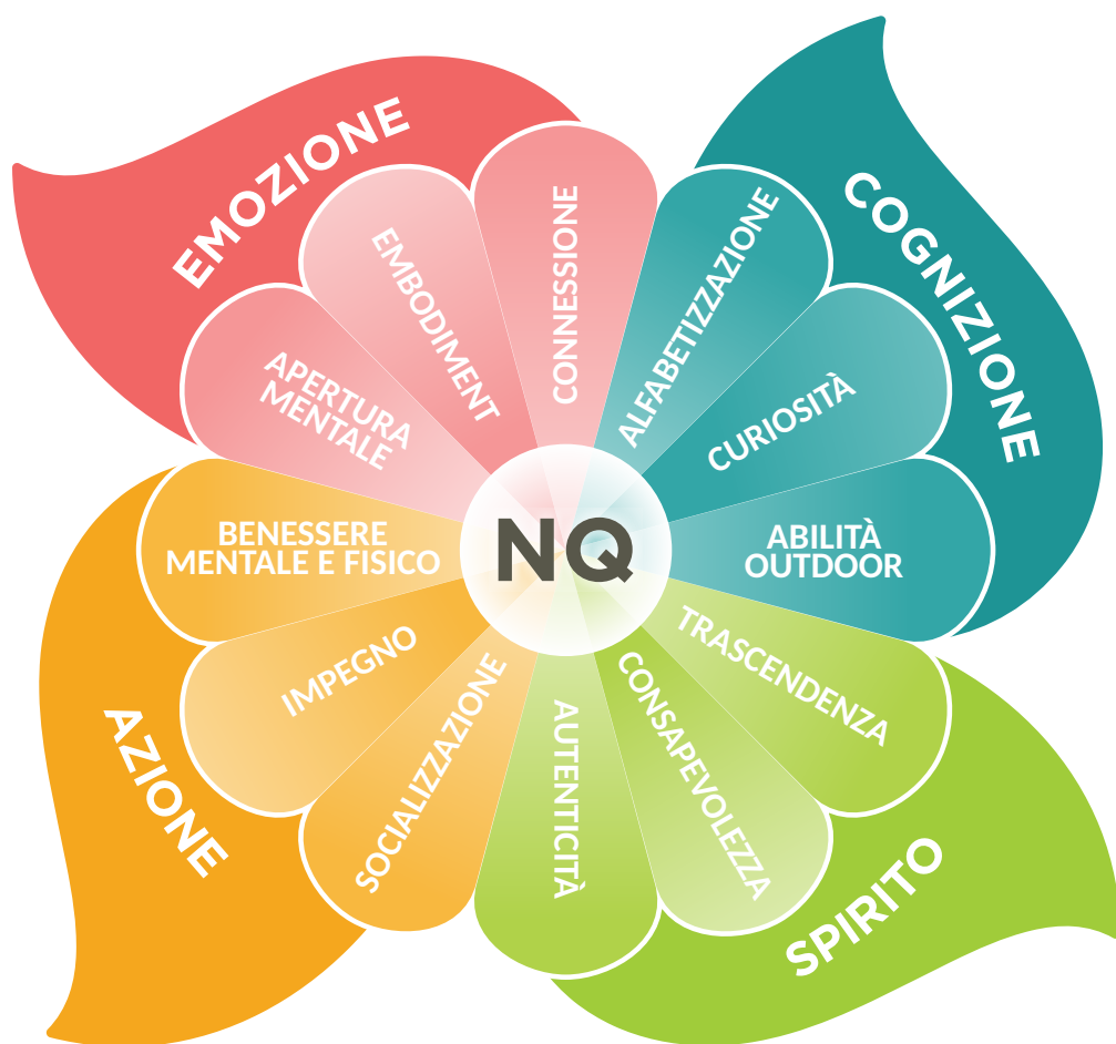
Figura 1. Il modello di fiore NQ

La Nature Intelligence è come una 'proprietà emergente', il che significa che è più della semplice somma delle sue dimensioni e competenze. In altre parole, è come dire che una persona è Nature Intelligent quando ha sviluppato abilità e competenze all'interno di tutte e quattro le dimensioni dell'NQ (cognizione, emozione, spirito, azione). Per dirla in modo più poetico, l'NQ può essere paragonato a un arcobaleno che appare nel momento e nel luogo giusti in presenza di una particolare condizione. La tabella 2 descrive le quattro dimensioni della Nature Intelligence e le tre competenze proprie di ciascuna dimensione. La figura 1 illustra il concetto attraverso un "fiore".